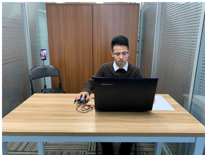
图一：电脑端正面视角