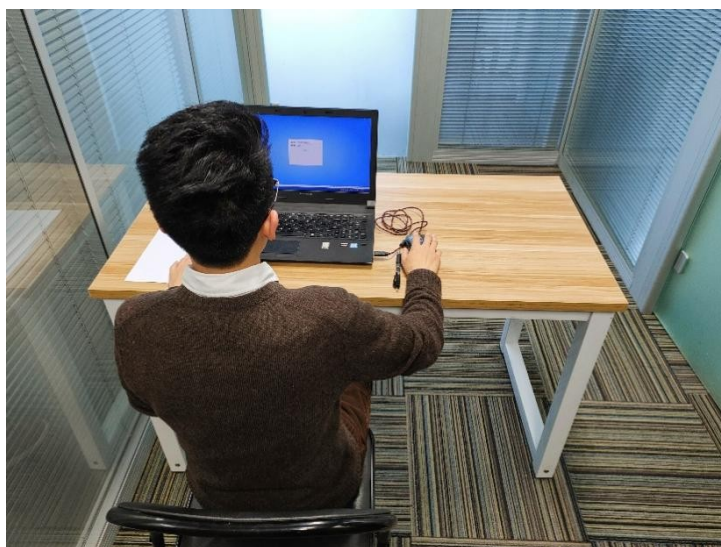
图二：电脑端背面视角