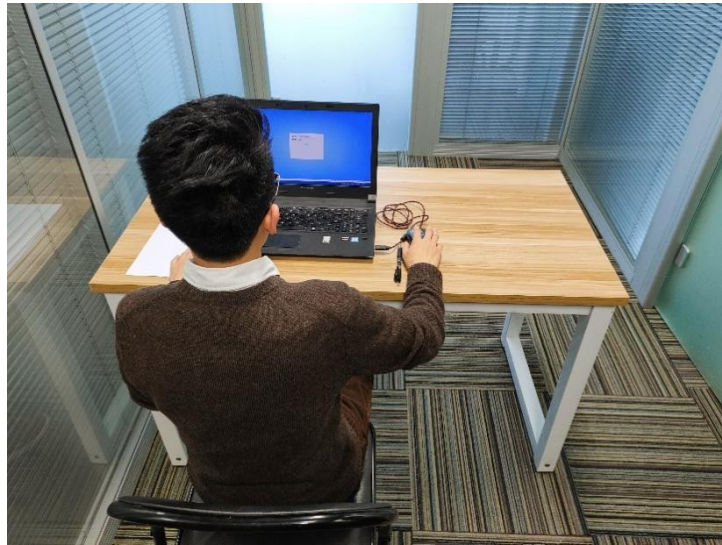
图二：电脑端背面视角